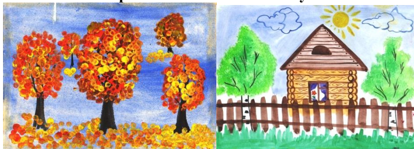
Иллюстрирование сказки «Курочка Ряба». Гуашь.

Деревенский пейзаж. Акварель. Осенний пейзаж. Гуашь.